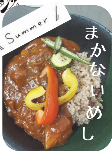
番長お手製カレー、絶品でした！

たまな商店 HP 掲載中の「白浜さんぽ365」でも情報をお届けしています。HPはコチラ→