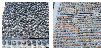
↑ 余裕ゾーン ↑ 激痛ゾーン

たまな商店「白浜さんぽ365」で紹介されていた道の駅志原海岸の“足つぼロード”へ行って来ました！ 痛いのは覚悟の上、いざ挑戦！予想外に、気持ちい〜♪と余裕でスタートしたのも束の間、石の大きさや形状が違うゾーンに突入したとたん、動けず…。そんな母の横を猛ダツシュで往復する我が子。まったく痛くないとのこと！手すりにつかまりながらも母は何とかゴールしました。近くのベンチで休んでいると、足がぼかぼかして身体がすごく軽くなりました。目の前にドーンとひろがる太平洋をしばし眺めつつコーヒータイム。心もカラダもほぐされました♪近くには、つるすべ泉質で人気の温泉やBBQレストラン、道の駅内では特産品や朝採れ野菜、焼き立てパンの販売もあり、一日満喫まちがいなしです！